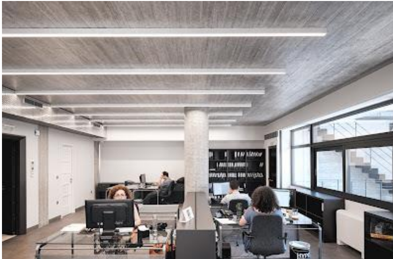
Εικ.13,14,15. Η αντιπρόταση των νέων αρχιτεκτόνων απέναντι στον ακραίο μινιμαλιστικό υπερχεδιασμό: Όλα τα σταθερά και κινητά στοιχεία του εσωτερικού και εξωτερικού χώρου υπακούουν σε ένα φυσιολογικό κοινό μέτρο που συγκροτεί το Όλο.

Είναι "το Δοχείο (ανθρώπινης και όχι εξωγήινης) Ζωής".