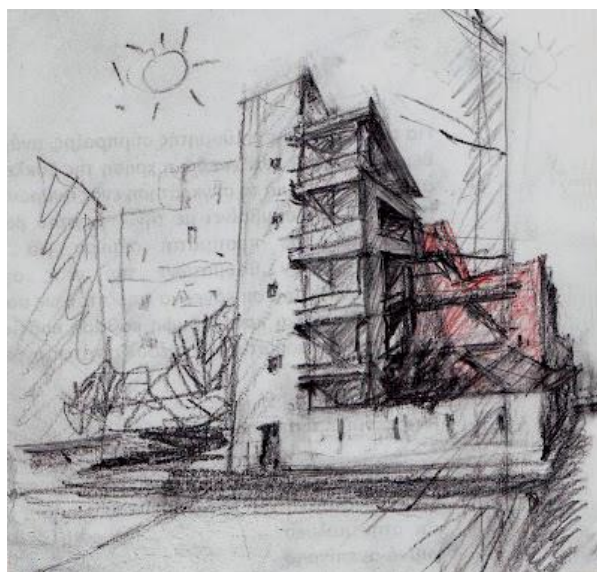
Εικ.2. Οδός Λαμψάκου 7