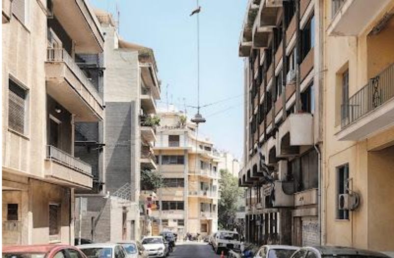
Εικ. 3,4. Περπατώντας στην οδό Λαμψάκου, από το ιστορικό κτίριο του Γ. Κοντολέοντα προς το νέο κτίριο.

Οι νεότεροι σεβάστηκαν το μάθημα του - παλαιότερού τους - αρχιτέκτονα. Ήταν άλλωστε ήδη αρκετά πεπαιδευμένοι από μόνοι τους στο να διακρίνουν και να ερμηνεύσουν τα σημάδια του « διαρκούς Μοντέρνου » στην ιστορική πολυκατοικία. Αλλά και πώς αυτά το οδηγούν, από το παρελθόν του προς το μέλλον του.